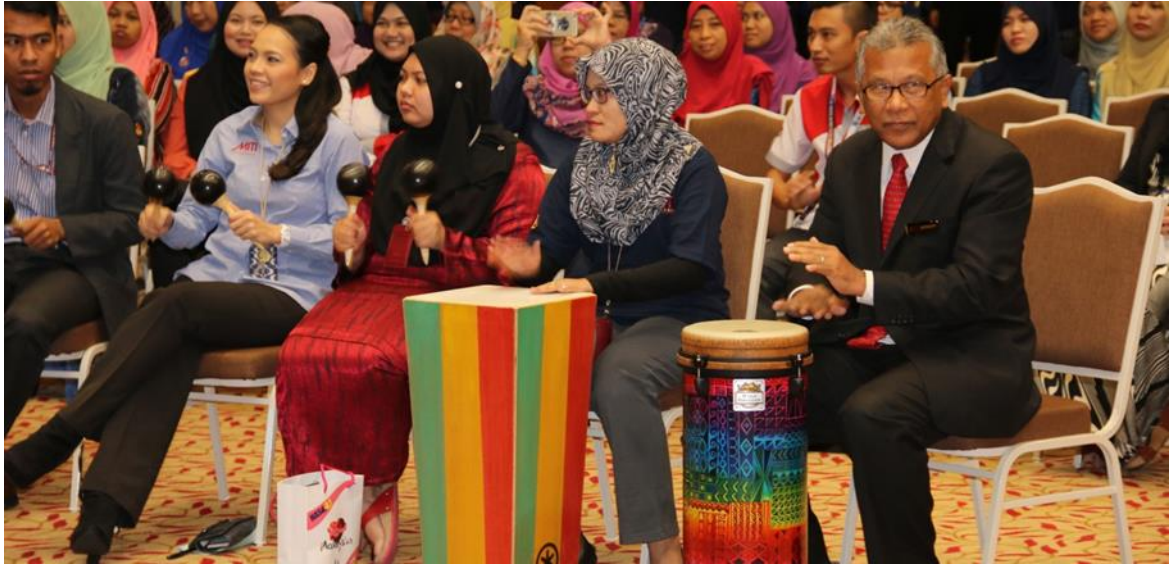
Sesi Happy Drumming bersama Datuk Seri J. Jayasiri sempena HR Open Day pada 3 November 2016.