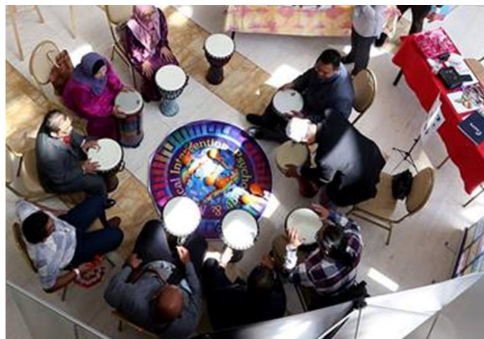
Aplikasi Intervensi Muzik semasa Persidangan Psikologi Perkhidmatan Awam 2016 bertarikh 4-6 Oktober 2016 di Presint 2 Putrajaya.