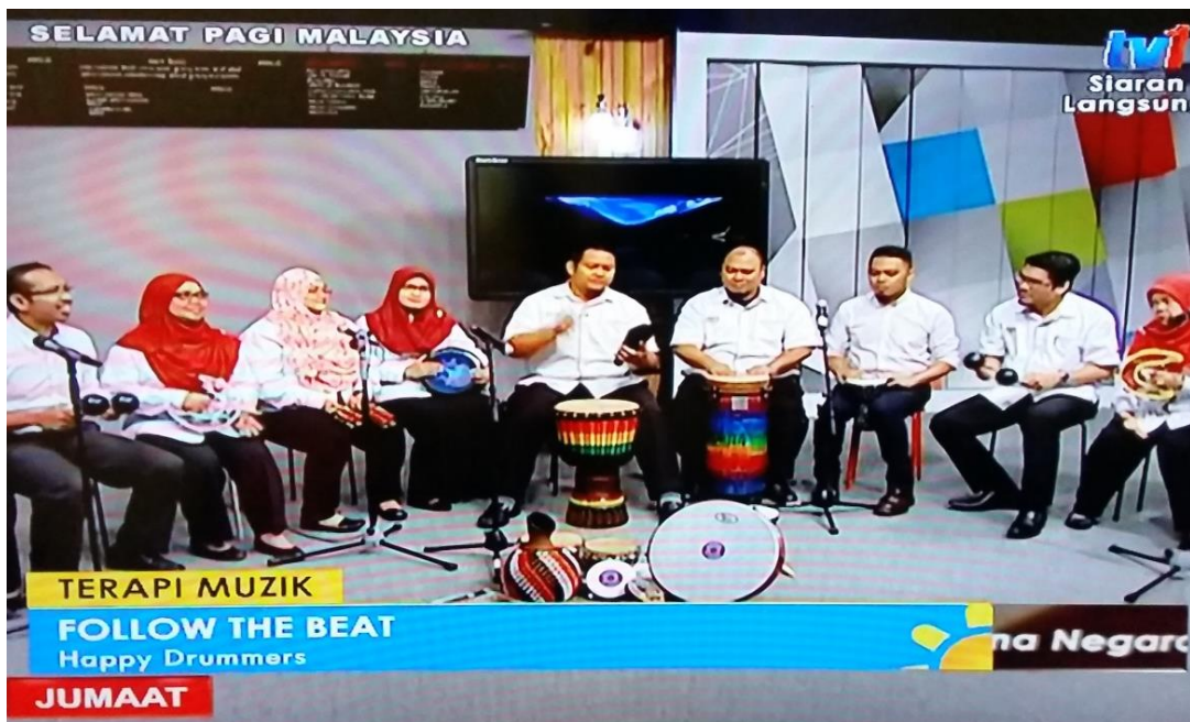
Aplikasi Intervensi Muzik telah disiarkan secara langsung dalam rancangan Selamat Pagi Malaysia (TV1) pada 26 November 2016