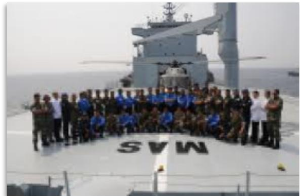
Gabungan pelbagai elemen