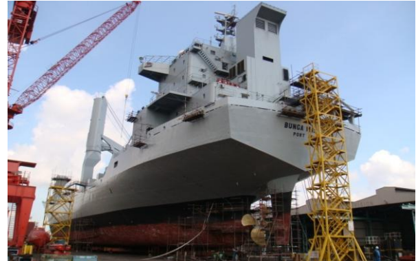
Cat baru - kelabu