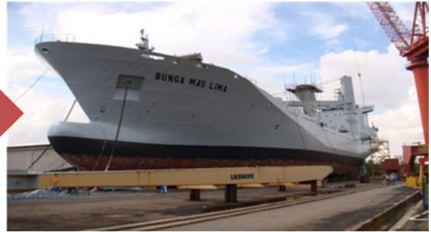
Kapal Auxiliary Bunga Mas 5