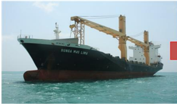
Kapal Dagang MISC