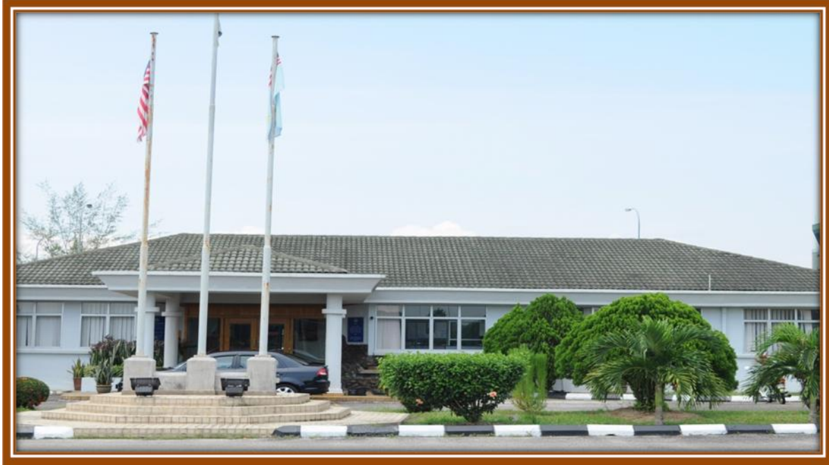
Gambar 1. Markas Tadbir